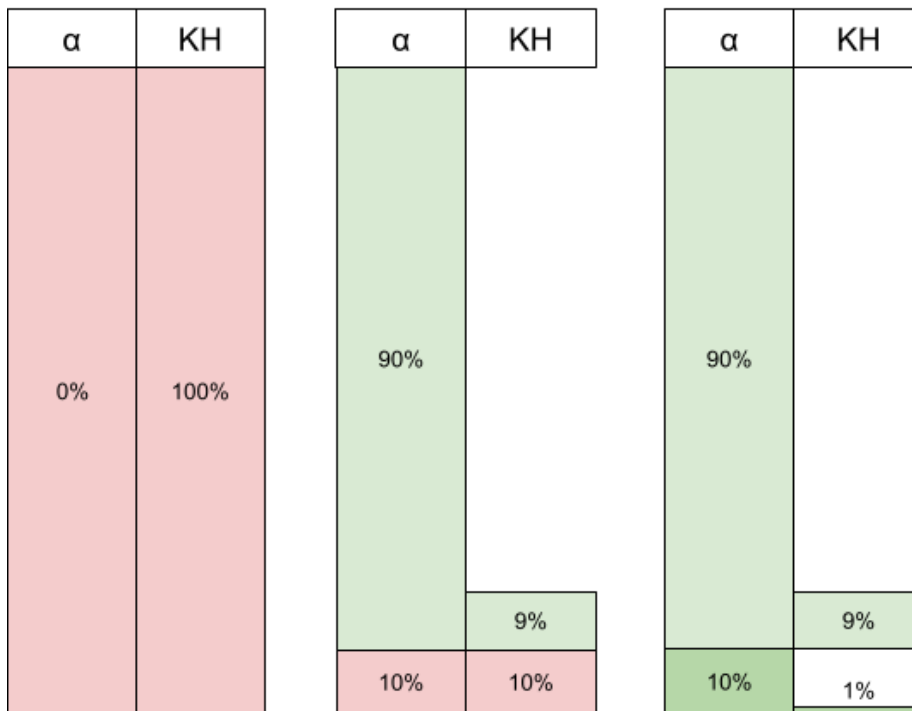
Abbildung. 2: Darstellung der resultierenden KH-Belastung in Abhängigkeit von der Impfquote der Bevölkerung. Links: Ohne Impfungen; Mitte: Eine Impfquote von 90% ergibt in unserer Rechnung (siehe Text) eine resultierende KH-Belastung von insgesamt 19% im Vergleich zur KH-Belastung ohne Impfungen; Rechts: Nach Impfung der verbleibenden 10% ergibt sich eine verbleibende KH-Belastung von 10%.

\alpha = Impfquote (grün = geimpft; rot = ungeimpft) KH = Krankenhausbelastung